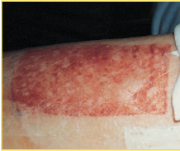
Site donneur de greffe.